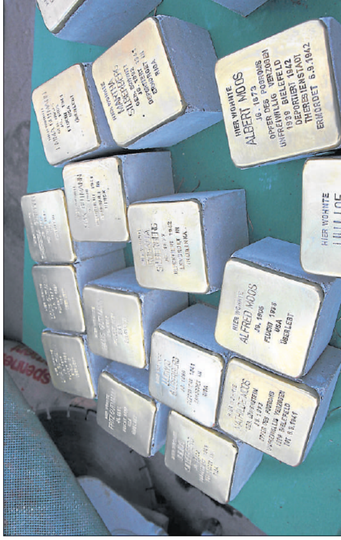
Der Höhepunkt der Jahresarbeit 2014 des Lippetaler Arbeitskreises „Familienforschung“ soll die Verlegung von „Stolpersteinen“ in Hovestadt und Oestinghausen sein. Das Foto zeigt Stolpersteine, die im November 2012 in Wadersloh verlegt wurden.